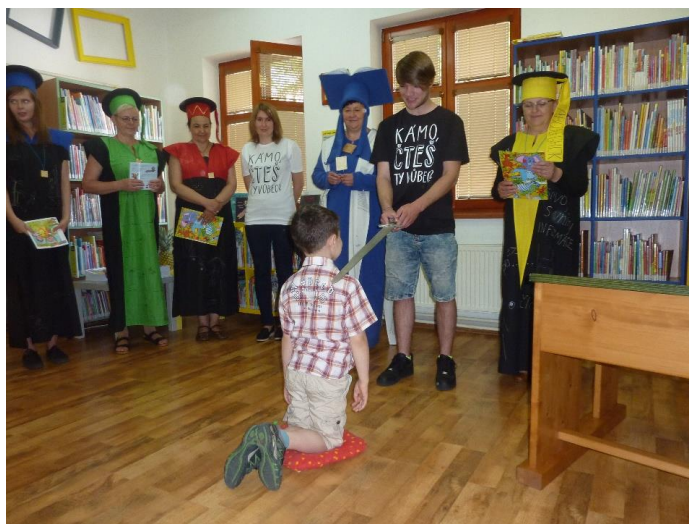
„Pasování na velké čtenáře“ pro absolventy prvních tříd