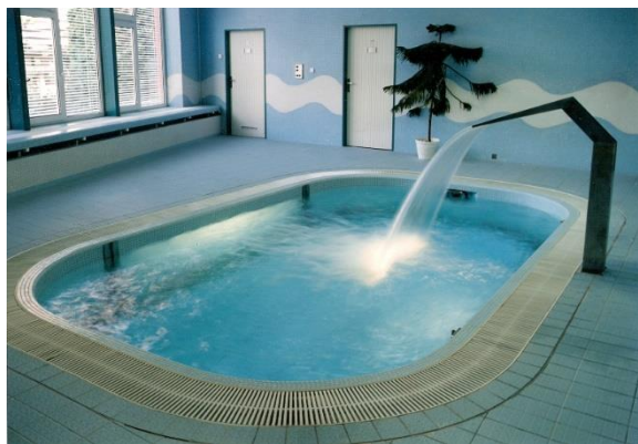
rehabilitační bazén s posuvným dnem