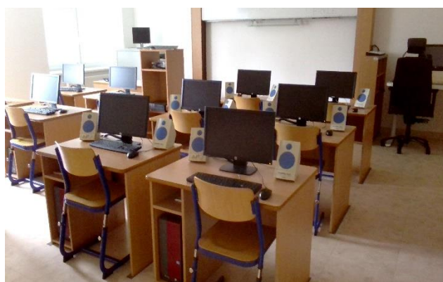
učebna výpočetní techniky