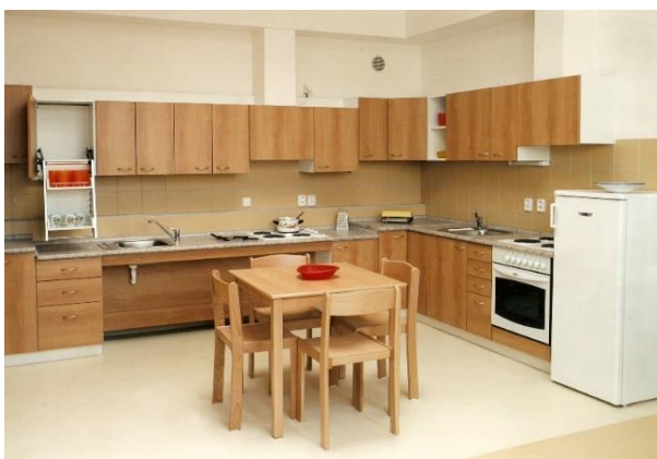
cvičná kuchyň s úpravami pro vozíčkáře

V sousedství školní zahrady bylo vybudováno dětské hřiště pro nejmladší žáky školy.