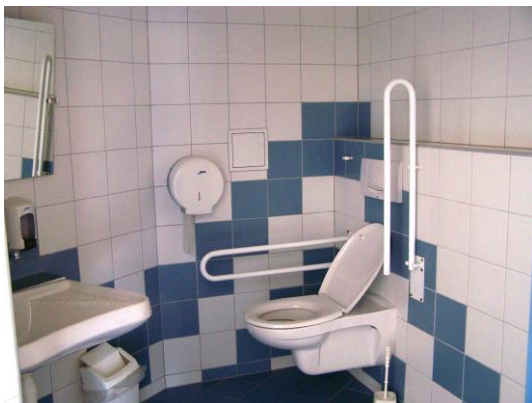
toaleta pro vozíčkáře

Budova školy je vybavena vysokým počtem běžných toalet i toalet upravených pro vozíčkáře. K dispozici je i řada sprchových koutů pro učitele a žáky. Některé z nich jsou rovněž upraveny pro potřeby vozíčkářů.